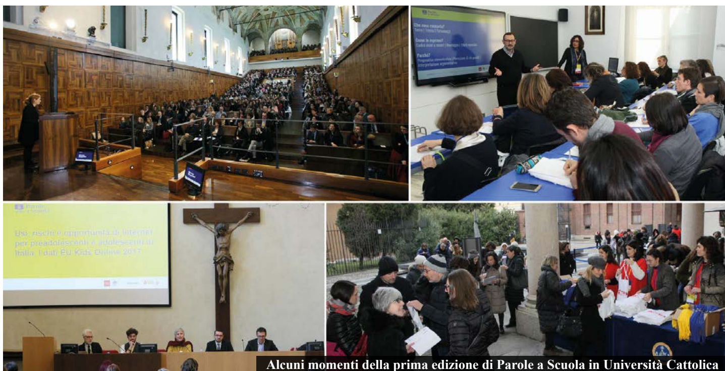
Alcuni momenti della prima edizione di Parole a Scuola in Università Cattolica