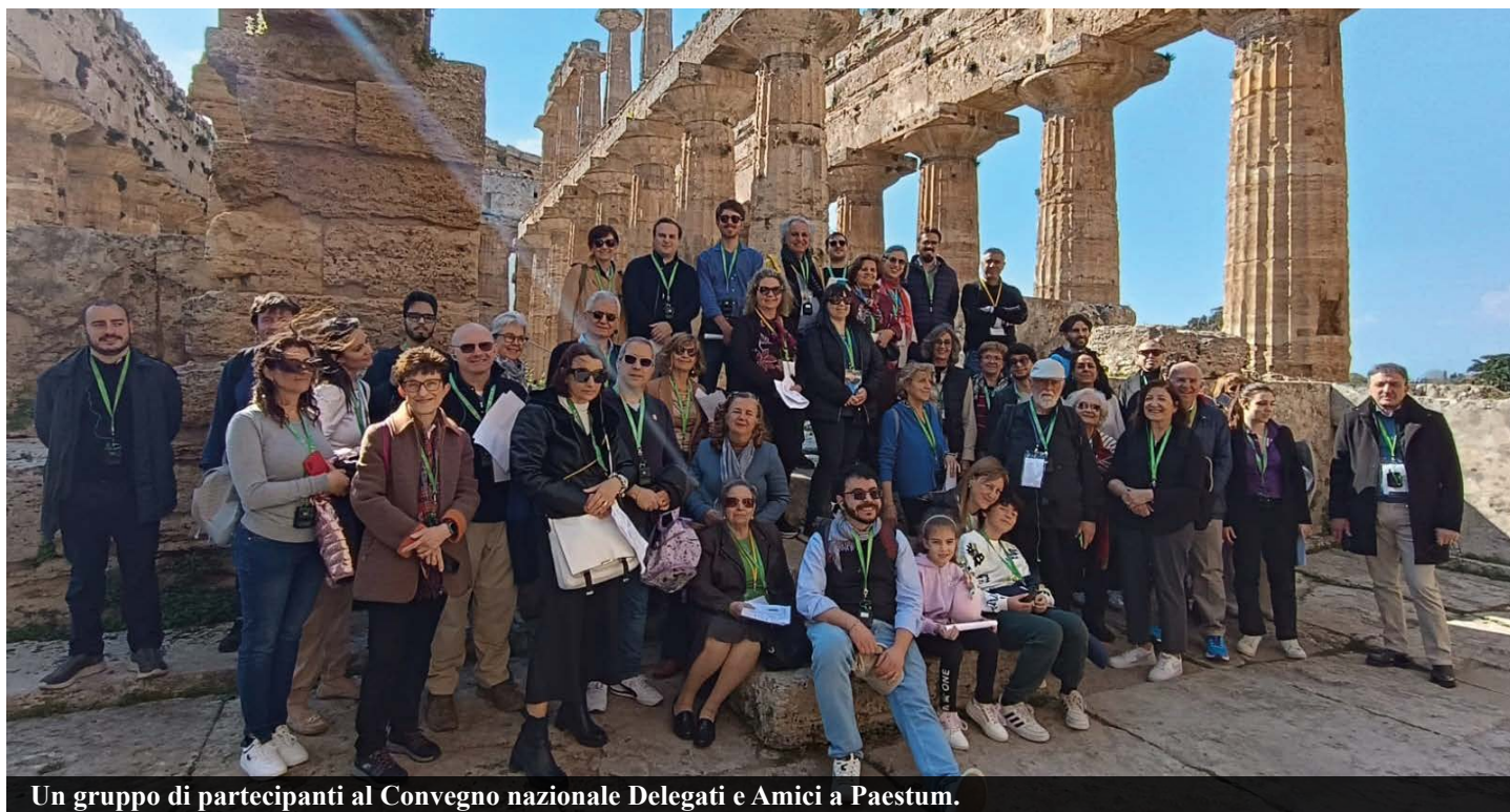
Un gruppo di partecipanti al Convegno nazionale Delegati e Amici a Paestum.

fertile. Un aspetto chiave emerso da Paestum è, dunque, che il potenziale cambiamento che nasce dal confronto intergenerazionale non deve far paura. Anzi, va abitato. E la presenza dei giovani, con le loro proposte e provocazioni, ha avuto un ruolo centrale: non solo come “voci da ascoltare”, ma come parte attiva, capace di essere anche “amico critico”, nel senso più serio e costruttivo del termine. Pertanto, promuovere incontri tra generazioni, in contesti laboratoriali reali, si è rivelata un'operazione preziosa. Non solo per condividere buone pratiche, ma per far emergere tensioni, cercare insieme risposte e, soprattutto, generare occasioni. Questo è forse il lascito più forte di Paestum: non una somma di relazioni o di contenuti, ma un'esperienza in cui ci si è sentiti parte di qualcosa che cresce se si è disposti a mettersi in gioco, davvero, insieme.