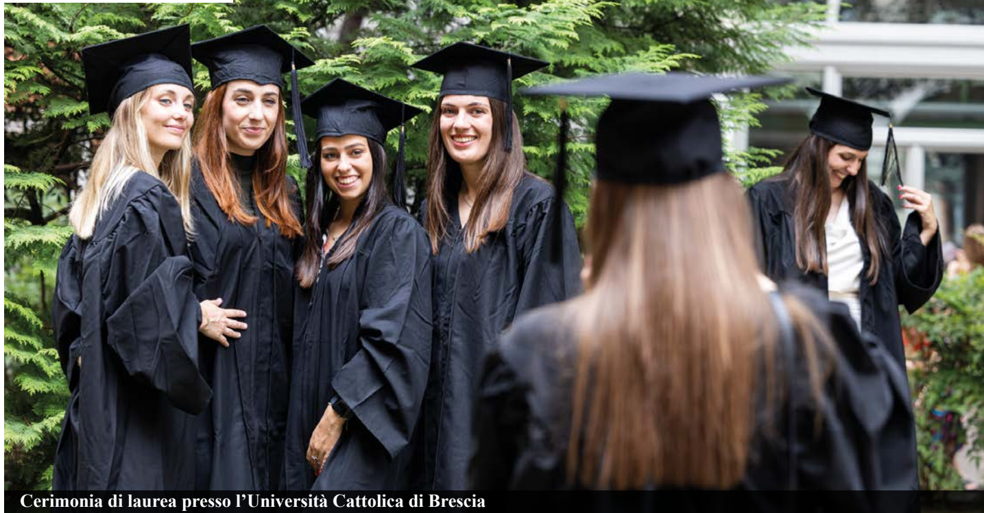
Cerimonia di laurea presso l'Università Cattolica di Brescia